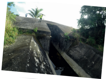
Barrage écrêteur de crue de Petit-Pérou aux Abymes du 30 avril 2022

Si je souhaite réaliser des travaux, je suis accompagné par un expert dans le montage de mon dossier de demande de subvention